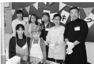
参加された皆さん

今回は、簡単に生地から作るエビピザとおしゃれなサーモンカルパッチョを作りました。受講生の皆さんは楽しそうにピザ生地をこねていただきました。試食は黙食となりましたが、とてもおいしくいただきました。