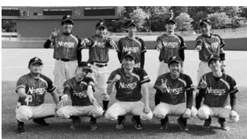
泉崎ノイジーズの皆さん

泉崎ノイジーズは、1回戦でいわき菊田クラブと対戦し、3対2で勝利しました。2回戦では全白河野球クラブを相手に初回から激戦を繰り広げ、13対12で見事勝利を飾りました。1・2回戦とも、全員野球で接戦を制し、準決勝進出を決めました。5月21日(土)にオールいわきクラブと準決勝を行う予定です。