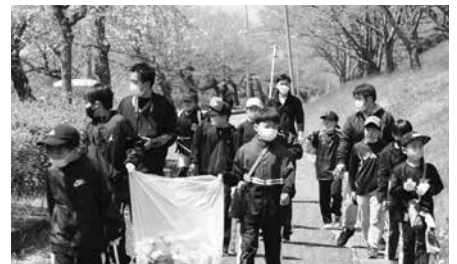
桜ウォークの様子