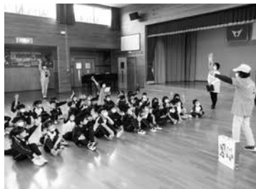
お話を聞く子どもたち

横断歩道の渡り方や信号の見方を教えてもらい、交通ルールの確認をしました。また、交通安全母の会より子ども一人ひとりにポケットティッシュが配られました。