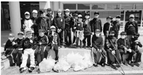
たくさんのゴミを拾った少年団の皆さん

村内の桜が散り始めた4月17日(日)に、泉崎ミニバスケットボールスポーツ少年団の小学1年生、6年生の団員約30名が桜ウォークを行いました。桜ウォークでは、ゴミ袋を持ちながら村内を約5km歩き、5袋分のゴミを回収しました。村民の皆さん、ポイ捨てをしないように心掛けましょう。