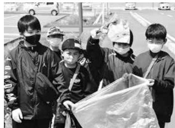
袋を持ちながら歩きました