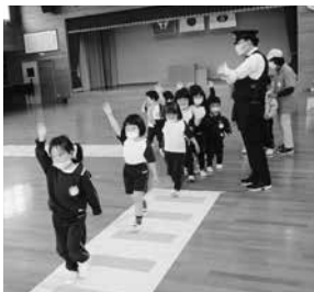
交通安全教室の様子