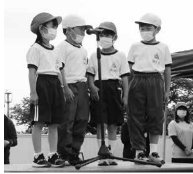
児童代表による開会の言葉