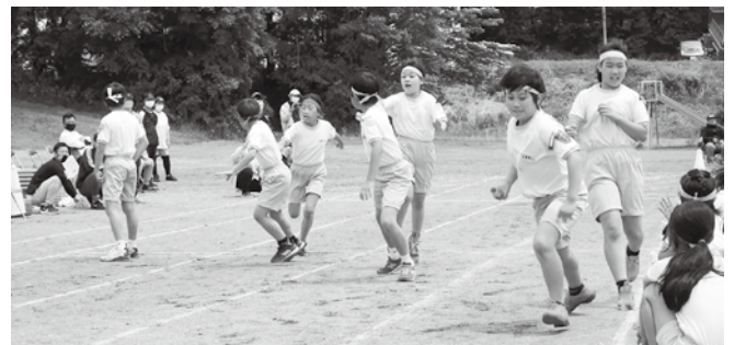
上学年選抜紅白対抗リレー