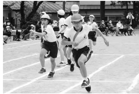
全学年による紅白リレー