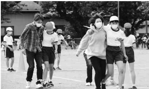
親子競技「強いきずなで…」（6年）