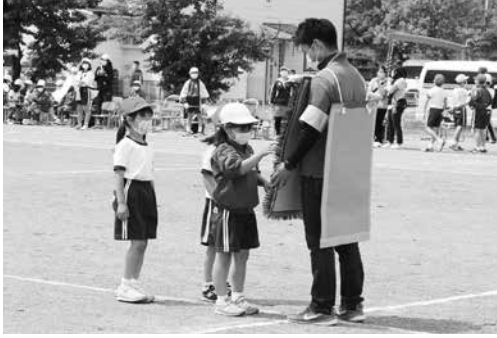
ラッキーカラーは何色？（1・2年）