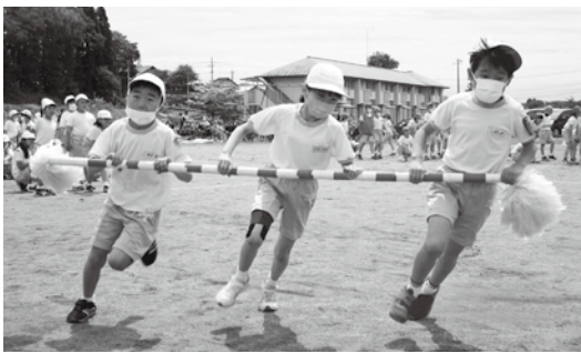
泉二小台風ン(3・4年)