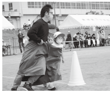
親子で仲良くデカパンリレー(1年)