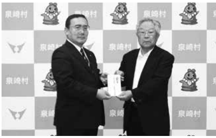
目録を手渡す古宇田会長(右)