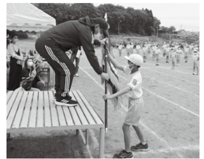
優勝旗・参加賞授与