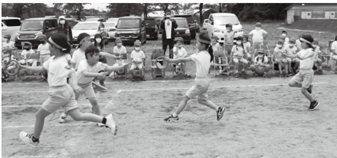
下学年選抜紅白対抗リレー