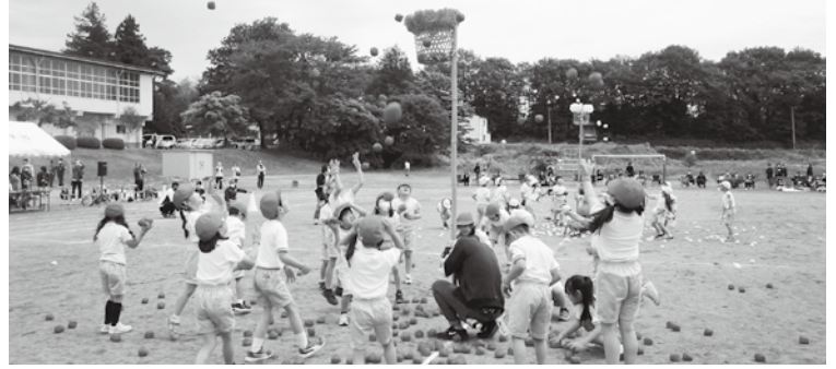
なかよし玉入れ (1・2年)