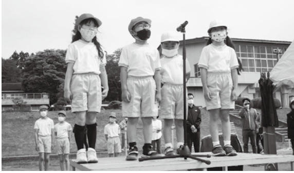
児童代表による開会の言葉