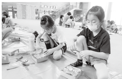
キラキラ箱制作の様子

するための情報収集力を身につけることを目的として実施しています。また、グループで実施することで、協調性やコミュニケーション力も必要となります。これからも様々な教室を通して、たくさんの方の身に付けて欲しいと思います。