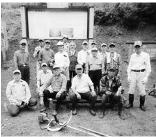
いちよの会の皆さん

いちよの会では会員を募集しています。活動内容は小学校や幼稚園のイベントのお手伝い、主催事業としては、12月に門松を作り、幼稚園や役場などに設置したり、1月には、どんど焼きを主催したりしています。詳細については、中央公民館(☎53・2258)までお問い合わせください。