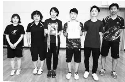
優勝した峠支部の皆さん

支部対抗卓球大会 7月9日(土)支部対抗卓球大会がトレーニングセンターで開催され、4支部の参加によりリーグ戦方式で熱戦が繰り広げられました。試合結果は次のとおりです。 優勝 峠支部 準優勝 八雲支部 第3位 関和久支部