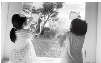
光に透かして楽しむ児童

Izumizaki-Country Village B・B・Q Plan 2022 4/1~11/30