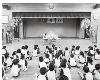
紙芝居を見る子どもたち