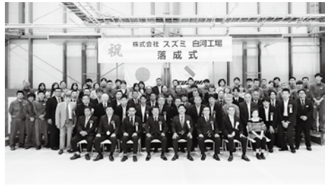
株式会社スズミの皆さん