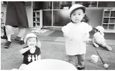
水風船で遊ぶ子どもたち

こまめに水分補給をすることを心掛け、熱中症に注意しながら水遊びを楽しんでいきたいと思えます。