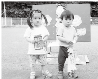
願い事を書いた子どもたち

子どもたちはテラスに座り、七夕の由来の話や七夕飾りの話を聞き、各クラスの代表の子どもたちが願い事を書いた短冊の紹介をしました。最後に子どもたち全員で「たなばたさま」を歌い、七夕まつりを楽しみました。