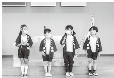
年長組代表児によるお迎えの言葉