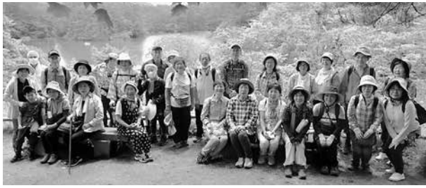
ハイキングに参加された皆さん

村民ハイキング 6月18日(土)裏磐梯五色沼散策コースで村民ハイキングが行われました。新型コロナウイルス感染症の影響により久しぶりの実施となりました。裏磐梯物産館入口より出発し、神秘的な8つの湖沼を眺めながら、1時間30分かけてゴールするルートを歩きました。梅雨の晴れ間に恵まれ、全員無事にゴールすることができ、爽やかな汗をかきました。