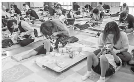
仕上げ磨きの様子