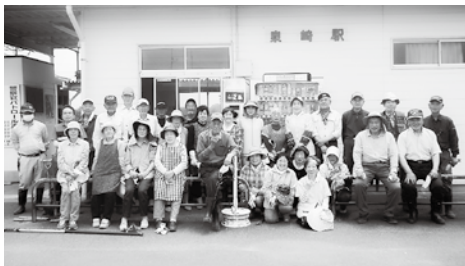
環境美化作戦に参加された皆さん