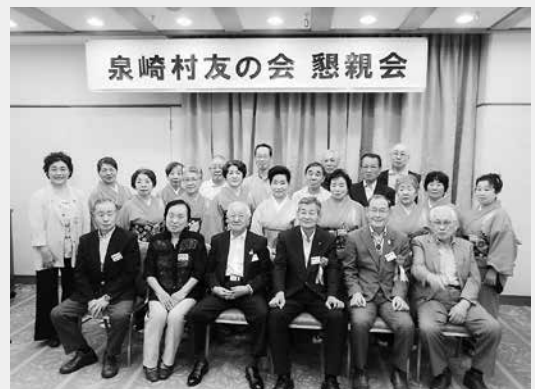
令和元年度の懇親会の様子