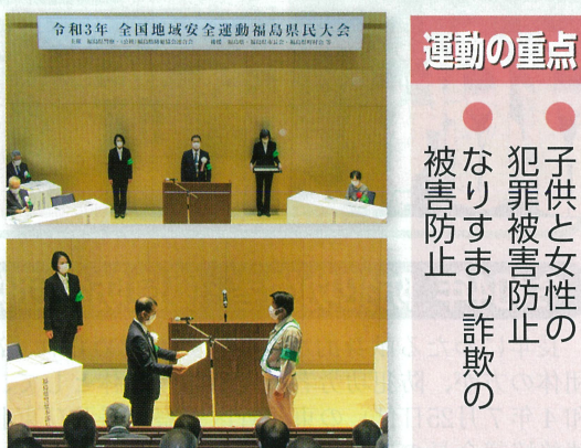
昨年、三春町のコミュニティ福島で開催された福島県民大会の様

令和4年全国地域安全運動福島県民大会 日時: 令和4年10月13日(木)午後2時30分 場所: 郡山市立中央公民館