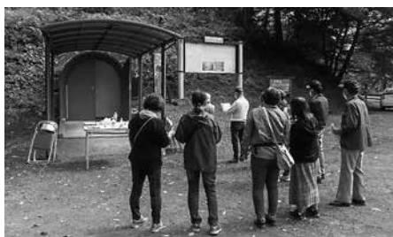
横穴一般公開の様子