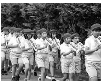
力強く演奏する児童