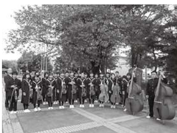
全国大会に出場する器楽部の皆さん

また、10月13日(木)に行われた県下音楽祭(第76回県下小・中学校音楽祭兼日本学校合奏コンクール県大会)では、惜しくも全国大会には選出されませんでした。が、「金賞」を受賞しました。 10月15日(土)に泉崎中学校白樺祭(文化祭)が行われ、生徒及び保護者に報告を兼ねて演奏が披露されました。