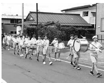
鼓笛パレードの様子

参加した4、5、6年生の児童62名は第二小学校から瀬知房を経由し磯八へ向かい、沿道の保護者や近所の住民の方々の声援を受けながら、力強い演奏に『交通事故ゼロ』の思いを乗せて行進しました。