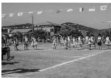
年少リズム「ポポポポーズ」

公開当日は、天候にも恵まれ村内、県内、遠くは岡山県、愛知県、静岡県などから約100名の方が観覧にお越しくださいました。