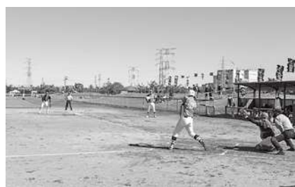
ソフトボール大会の様子

10月8日(土)から相馬市で第9回市町村対抗福島県ソフトボール大会が開催されました。