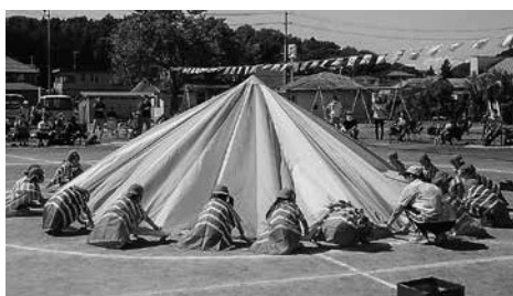
年長リズム「響け心に☆届け君に☆～ECHO～」