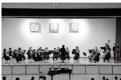
白樺祭での器楽部による演奏

泉崎中学校「器楽部」は、10月10日(月)に開催された令和4年度「こども音楽コンクール」東北大会に出場し、中学校合奏第1部門で「最優秀賞」を受賞し、全国大会に出場します。福島地区大会で「優秀賞」を受賞し県代表となり、東北大会では「最優秀賞」を受賞し東北代表として、文部科学大臣賞選考会(全国大会)に出場します。なお、全国大会は東北大会で収録した音源で審査を受けることとなります。