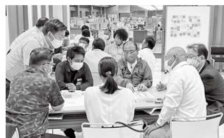
村づくり委員会の様子

第1回村づくり委員会は役場職員を加えた総勢64名が参加し、『こんな村に住んでみたい』というテーマで、『未来の子育て環境』や『少子化対策の工夫』など、幅広く自由なアイデアについて話し合われました。