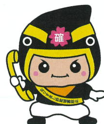
カクニンジャー福くん

もしもこのような場面に直面したら、相手の言うこと に従わず必ず提示等を断り、まずは警察や家族に相談 をして下さい!!