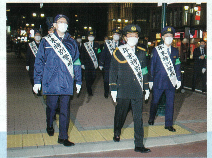
令和3年 年末警戒パトロール

一昨年からの新型コロナウイルスに係る厳しい社会情勢の中、県内各地区で防犯ボランティア等による地域安全活動が積極的に展開されていますが、年末年始の期間は、強盗事件等の発生が懸念される時期です。年末年始の事件・事故を防止し、明るい新年を迎えましょう。