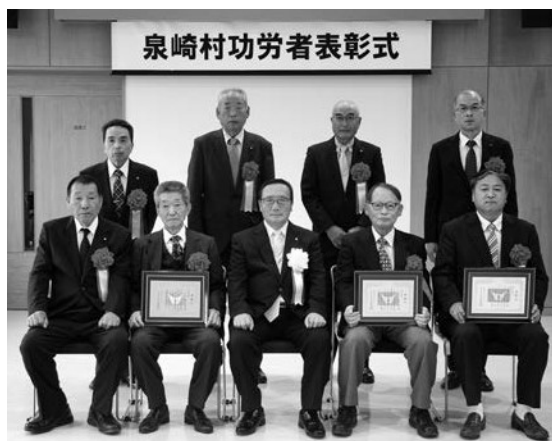
表彰式にご出席された皆様

令和4年7月19日に泉崎村教育費資金として多額の金員を寄附され、本村の教育・文化の推進に大いに寄与されました。