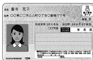
身分証明書となる「マイナンバーカード」

※正当な理由がなく住民票の異動の届出をしない場合、5万円以下の過料に処されることがあります。