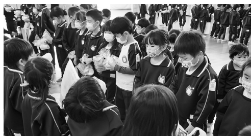
年中組からのプレゼントをもらう年長組の子どもたち