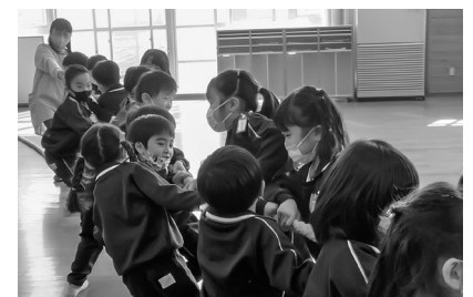
力を合わせて勝負する子どもたち