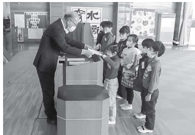
修了証書授与式の様子

今年度、年間を通してご協力をいただきました、関係者の方々に心より感謝申し上げます。