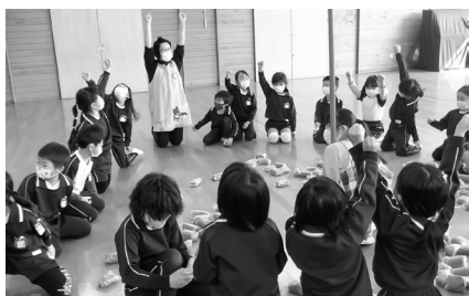
玉入れの優勝を喜ぶ子どもたち

年長組の姿は、年少組、年中組の子どもたちにとってはとても大きく、いつも憧れの存在です。憧れの気持ち、優しさのバトンには、しっかりと受け継がれていきます。年長組の皆さん、たくさんの優しさと思い出をありがとうございました。