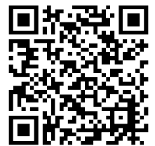
ホームページはこちら

福島県環境創造センターでは、身近な河川等での水生生物による水質調査を通じて、水環境に親しんでもらうため、毎年せせらぎスクール推進事業を実施しています。市民団体等に参加を呼び掛け、申したいだいた団体等に対し水生生物調査に必要な資材を無償で提供しています。詳細はホームページをご覧ください。