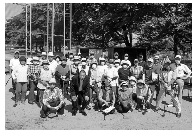
参加された皆さん