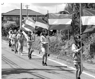
鼓笛パレードの様子