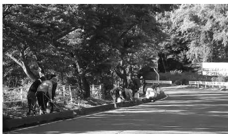
クリーンアップ作戦の様子

なお、第3回目は9月3日(日)を予定しています。今後も、ゴミのない泉崎村を目指して、村民の皆さん、ご協力をよろしくお願いいたします。