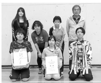
優勝した峠支部の皆さん

6月3日(土)トレーニングセンターにて、支部対抗卓球大会が開催され、6支部7チームによる予選リーグ戦を行い、決勝トーナメント方式で熱戦が繰り広げられました。試合の結果は次のとおりです。