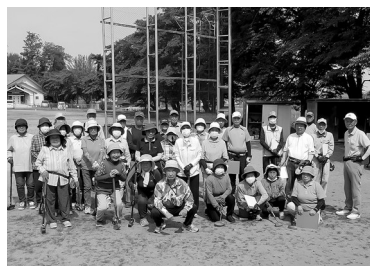
参加された皆さん