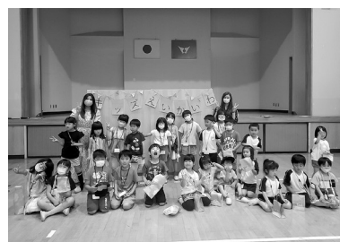
英会話教室に参加された皆さん

英会話教室は6月から12月までの水曜日に開催され、ハロウィン、クリスマス会もあり、生きた英語を学んでいきます。興味のある方は中央公民館までご連絡ください。 (☎53・2258)