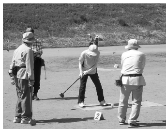
ゴルフ大会の様子