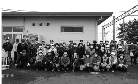
除草作業に参加された皆さん

赤十字奉仕団員、民生児童委員合わせて40名以上の方が参加し、約一時間の作業で大変きれいになりました。ありがとうございました。