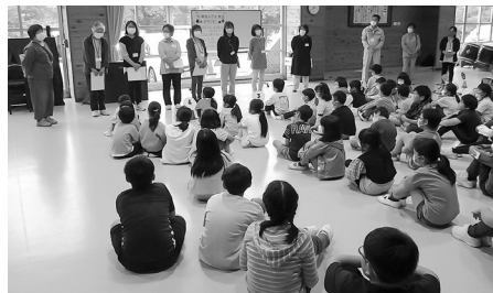
真剣にお話を聞く子どもたち

上がりで初回を締めくくりました。これからの教室でもたくさんの方たちと触れ合い、多くの経験を積んでほしいと思います。