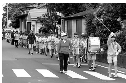
力強く演奏する児童

参加した4、5、6年生の児童は、第二小学校から磯八へ向かう道を沿道の保護者や近所の住民の方々の声援を受けながら、力強い演奏に「交通事故ゼロ」の思いを乗せて行進しました。