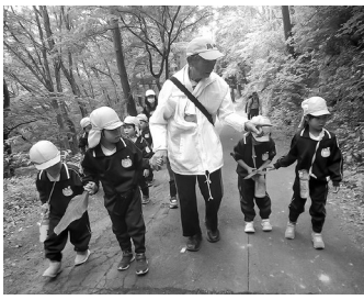
山頂を目指す子どもたち

「鳥峠の自然を守る会」による自然観察会が、5月19日(金)に幼稚園年長児を対象に、6月1日(木)に第二小学校4年生児童を対象に鳥峠にて開催されました。