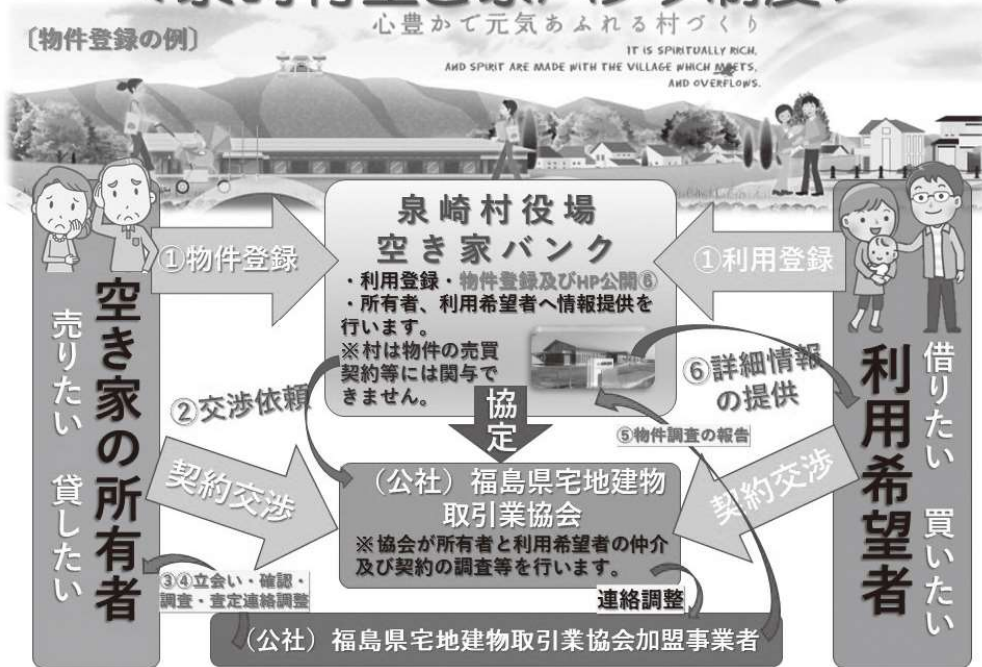
※空き家の物件登録・利用登録のイメージ図