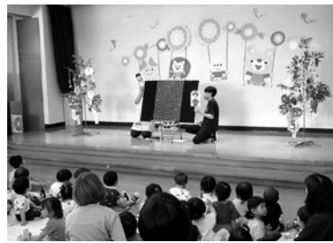
七夕まつりの様子

保育所「七夕まつり」 7月7日(金)泉崎保育所 ホールにて、七夕まつりが行われました。 ペープサートで七夕の由来の話を聞き、クラスの代表のお友達が先生と一緒に、短冊に書かれた願い事の紹介をしました。最後に子どもたち全員で心を込めて「たなばたまつりを楽しみました。」