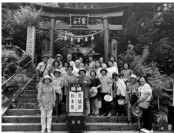
癒やし体験に参加された皆さん

せわしい毎日に疲れた心を癒やし、また、不思議体験として、栃木県・茨城県と2つの県にまたがる神社「鷲子山上神社」を参拝し、「那珂川水遊園」を見学しました。参加した皆さんはコロナに負けないパワーをもらい、元気いっぱいでした。