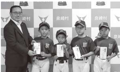
激励金を受け取るYNIスターズの皆さん

式には福島県南保健福祉事務所長、泉崎村長、泉崎村議会議長、泉崎村老人クラブ連合会長が出席し、知事賀寿、村長賀寿、記念品等の贈呈がそれぞれ行われ、ご家族に囲まれながら長寿を祝いました。 これからも穏やかに過ごされ、お元気で長生きしてください。