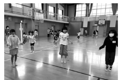
縄跳びに挑戦する児童

鳥峠の自然を守る会の皆さんによる清掃活動 6月25日(日)鳥峠の自然を守る会による鳥峠の草刈りと清掃活動が実施されました。 気持ちよく峠を登ることができるよう、また多くの方に自然を楽しんでもらえるようにと山道の草刈りと、トイレの清掃を中心に環境整備を実施しました。