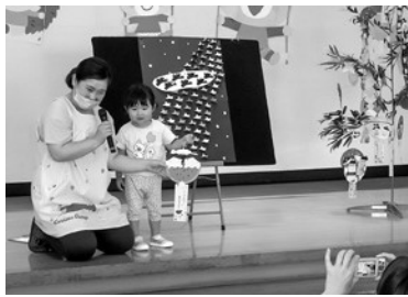
短冊紹介をする子どもたち