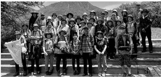
ハイキングに参加された皆さん

晴天に恵まれ、気温は少し高めでしたが、奥日光戦場ヶ原は爽やかな風が吹いていました。男体山を眺めながら木道の湿原、約4・5kmの道のりを2時間弱で歩きました。全員無事にゴールの湯滝に到着することができ、爽やかな汗をかきました。