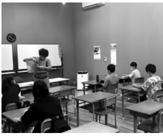
プチスクールの様子

6月24日(土)プチスクール（土曜学習会）が開講しました。プチスクールは小学5年生から中学3年生を対象に、村が主催し、無料で参加できる学習会です。今年は、50名以上の児童生徒が参加しています。