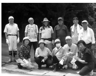
鳥峠の自然を守る会の皆さん

泉崎村放課後子ども教室「運動の日」 放課後子ども教室「運動の日」が、6月12日(月)に第一小学校1～3年生、6月19日(月)に第一小学校4～6年生、6月21日(水)に第二小学校を対象に実施されました。 教室では、ドッジビー、縄跳びなど、様々な運動遊びを用意し、体を動かしながらサポーターさんや他学年のお友達との交流の時間を楽しみました。 大人も子どもも一緒に思いきり体を動かして遊ぶことで、体力づくりとしてはもちろん、地域の大人との交流の時間としても大変有意義な時間となりました。