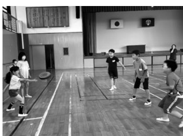
ドッジビーを楽しむ児童

泉崎村放課後子ども教室「放課後学習会」 放課後子ども教室の毎月定例の「放課後学習会」が、6月16日(金)に第二小学校で、6月26日(月)に第一小学校でそれぞれ開催されました。 放課後学習会は、普段放課後にお友達と宿題に取り組む時間の少ない児童へ学習の場を提供することを目的とし、今年度から子ども教室登録児の中でも児童クラブに登録していない児童を対象に実施しています。 少人数での実施でしたが、みんなで一緒に取り組むと集中力もアップするようで、真剣に宿題に取り組んでいました。 今後も学習会は月に1回程度実施していきます。