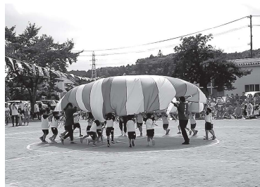
年長組・バルーン「Magic」