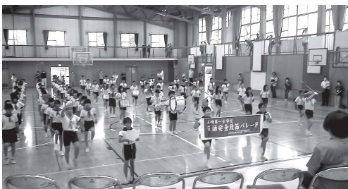
児童の皆さんによる演奏の様子