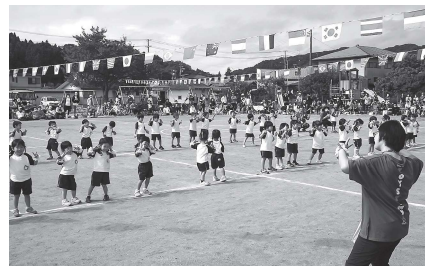
年少組・リズム「アンダー・ザ・シー」