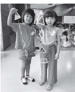
完成した飾りと記念撮影

今後も子ども教室では、子どもたちが地域活動に貢献できるような教室を実施していきたいと思えます。