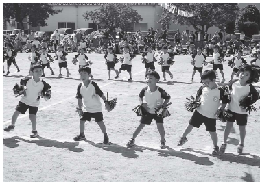
年中組・リズム「チグハグ」