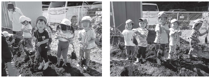
子どもたちによる芋ほりの様子

10月3日(火)泉崎保育所の畑にて、2歳児ちゅうりっぷ組といちご組による芋ほりが行われました。「よいしょ！よいしょ」と声を掛けながらツルを引っ張ると、様々な形のお芋が採れて、子どもたちは大喜びでした。土の感触を感じながらお友達と一緒にお芋の収穫を味わうことができました。