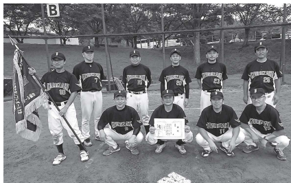
優勝された選手の皆さん

10月1日(日)白河市東風の台運動公園多目的グラウンドにて、ナガセケンコー旗争奪第28回白河・西白河壮年ソフトボール選手権大会が行われ、5チームが出場し、トーナメント方式で試合が進められました。 本村からは泉崎クラブが参加し、1回戦はセカンス(白河市)に勝利しました。決勝戦では、6-4でヤンキーズ(矢吹町)に勝利し、21年ぶり3回目の優勝を果たしました。 選手の皆さん大変お疲れ様でした。