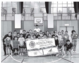
林選手、コーチとの集合写真

教室をとおして、プロの選手との交流の時間を持つことができ、とても貴重な時間となりました。