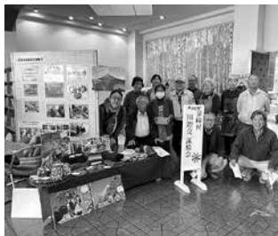
国際交流協会の皆さん

いずみぎマルシェ開催 10月29日(日)村文化祭の屋内運動会場にて、いずみぎマルシェが開催されました。 10店舗ご出店いただき、様々な食品やアクセサリー、子どもから大人まで楽しめるワークシヨップなどが並びました。 ご協力いただきました出店者の皆さん、お越しいただいた多くの皆さんありがとうございました。