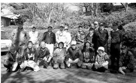
シルバー人材センターの皆さん

きれいに剪定していただき、快く来訪する方を迎えることができます。泉崎村シルバー人材センターの皆さん、ありがとうございました。