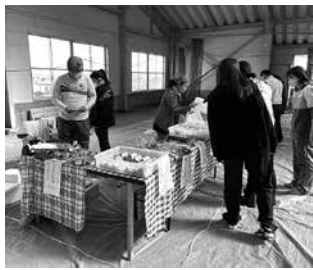
いずみぎマルシェの様子