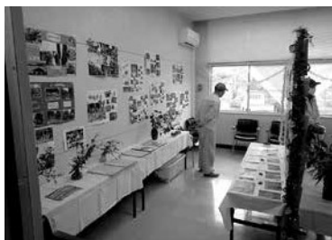
展示ブースの様子

国際交流協会 募金活動実施 泉崎村国際交流協会は10月29日(日)村文化祭にて、玉こんにやくと抹茶の販売をし、収益の一部を世界の国々の災害援助や学校教育支援を目的とした募金活動を実施しました。 お陰様で多くの皆さんの善意により、総額22,858円の収益が寄せられました。国際交流会員一同心より御礼申し上げます。ありがとうございました。