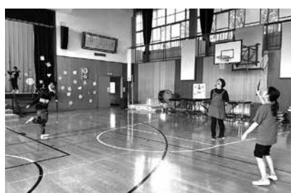
バドミントンを楽しむ一小の児童