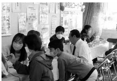
健康相談ブースの様子

泉崎村ボランティア連絡協議会 ども広場開催 泉崎村ボランティア連絡協議会は10月29日(日)村文化祭にて、ども広場を開催しました。 おかけ屋敷、射的、紙袋作成、塗り絵、水ヨーヨーなどの子どもたちが遊べる出しものを会員の皆さんと作り、文化祭当日、会場はたくさんの子どもたちで賑わいました。今年も中学生のボランティアも参加し、一生懸命作業を手伝ってくださいました。 ボランティア連絡協議会に興味のある方は中央公民館(☎53・2258)までご連絡ください。