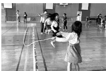
長縄に挑戦する二小の児童

実施しました。ドッチボール、縄跳び、バスケット、前回はなかったバドミントンなどの様々な運動遊びを用意し、各々好きな運動を選んで体を動かしながら、サポーターさんや他学年のお友達との交流を楽しみました。