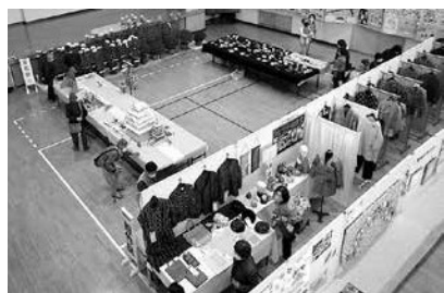
文化祭作品展の様子

作品は、園児、児童、生徒の絵画・書写や一般募集の作品、高齢者作品、公民館事業のハンドクラフト教室陶芸作品・成人学級絵手紙クラブ・絵画教室作品・俳句のほか、盆栽・菊花展など力作ばかりで、訪れた方々は素晴らしい作品の数々に見入っていました。