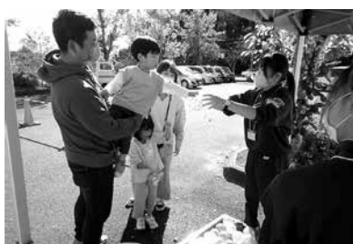
ボランティアに参加する中学生

鳥峠の自然を守る会 展示会開催 鳥峠の自然を守る会は10月29日(日)村文化祭にて、写真や本物の植物などを展示することで、鳥峠の魅力や峠に生息している動物、様々な季節ごとの植物などを、村民の皆さんに紹介しました。また、これまでに実施した自然観察会などの活動の様子も写真展示を通して紹介しました。 鳥峠の自然を守る会では、峠の案内人や清掃活動、自然観察会のお手伝いをしてくださる会員を募集しております。興味のある方は中央公民館(☎53・2258)までご連絡ください。