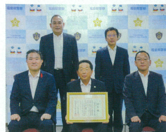
警察本部長に対する 受賞報告