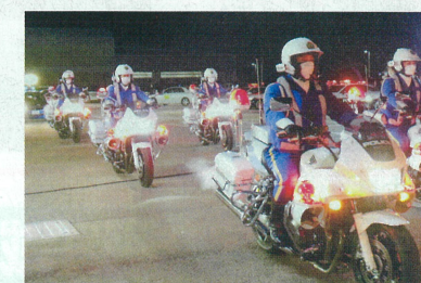
年末警戒パトロール (令和4年)

年末年始は、金融機関、コンビニ等を狙った強盗事件やひったくり、車上ねらい等の街頭犯罪の多発が懸念されます。また、子ども・女性や高齢者が被害となる事件等の発生も多く見られます。このようなことから、県警察、県防犯協会連合会、各地区防犯協会、防犯ボランティア等の関係機関・団体、地域の皆様の参加による地域安全活動を展開し、事件・事故のない住みよい福島県の実現を図ろうとするものです。 県民の皆様のご協力をお願いいたします。