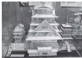
一般部門 本柳春治氏 【姫路城と五重の塔】