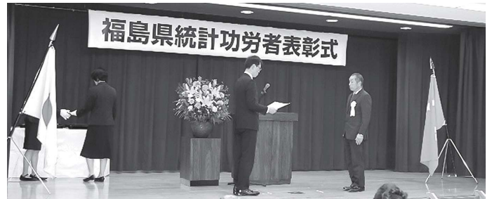
令和5年度福島県統計功労者表彰式