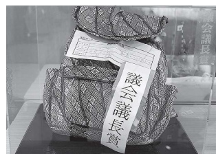
高齢者部門 小林文枝氏 【畳のへりで作成・リュックサック】