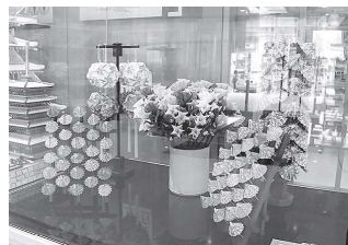
高齢者部門 高田昭一郎氏 【細工（折紙）】