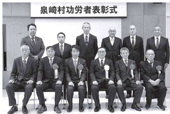
泉崎村功労者表彰式

式典では箭内村長から「皆さま方の惜しみないご協力が今日の泉崎村の発展、行政の推進、教育・文化の礎を築いたと言っても過言ではありません」と深い敬意と感謝の言葉が述べられました。今年度の受賞者と功績は次のとおりです。