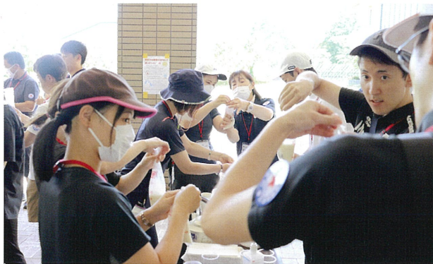
炊飯袋による非常炊き出し（ハイゼックス炊飯）体験