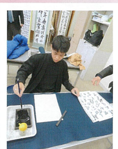
11月 タイJRCメンバーの受入（福島東高校で書道を体験）

赤十字が行う活動は、皆さまから寄せいただいた活動資金とボランティアで支えられています。皆さまのご支援により、災害救護をはじめ赤十字の活動を行えます。心より感謝申し上げます。