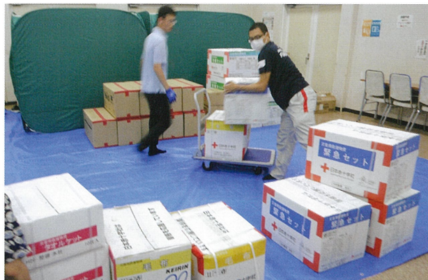
毛布、バスタオル、緊急セット、安眠セット、段ボールベッドを配布

日赤福島県支部では迅速な情報の収集に努め、いわき市へ職員を派遣し救援物資を届けたほか、あん摩マッサージ・はり・きゅう赤十字奉仕団によるマッサージ等を実施しました。