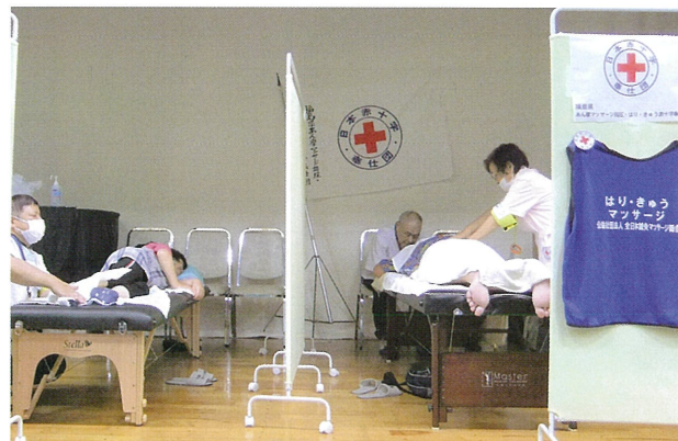
避難所の体育館のステージ上でマッサージを実施