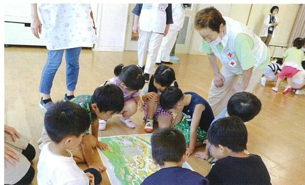
ぼうさいまちがいがし「きけんはっけん!」を保育所で実施