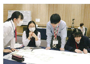
10月 北海道・東北ブロック高校青少年赤十字交流会（福島市）