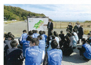
11月 栃木県高校JRCとの合同研修会（いわき市）