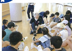
8月 小・中・高校生合同JRCトレーニングセンター（桑折町）