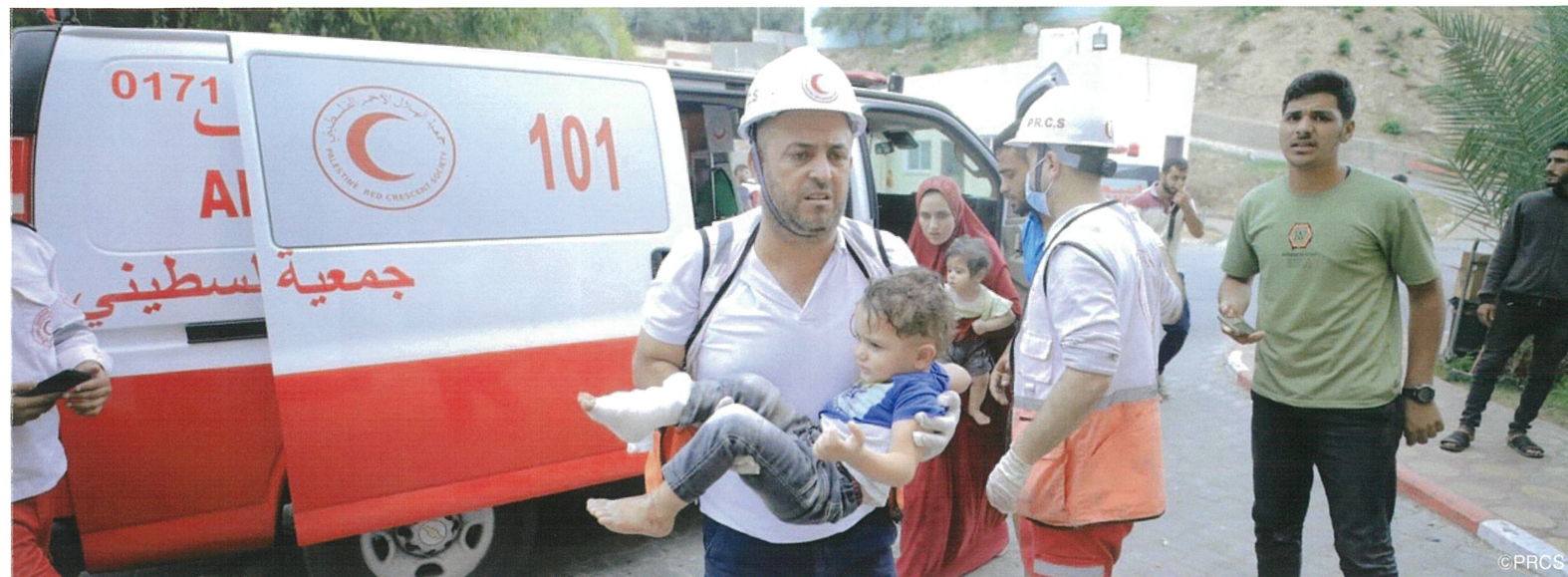
負傷した子どもを搬送するパレスチナ赤新月社のスタッフ