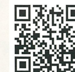
イスラエル・ガザ 人道危機速報

「私たちは単なる医療従事者ではなく、あなたの隣人であり、友人であり、家族です。私たちはガザに留まり、命を救うために全力を尽くしています。私たちは、すべての当事者が国際人道法を遵守し、医療従事者の安全を守ることを求めています。」(パレスチナ赤新月社Facebookより)