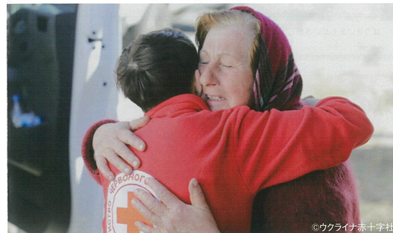
厳しい状況に苦しむ女性を元気づけるウクライナ赤十字のボランティア

赤十字は、人道・公平など赤十字の原則に基づき、中立的な立場から支援を提供します。イスラエル・ガザ人道危機においても、パレスチナ赤新月社とイスラエル・ダビデの赤盾社(イスラエルの赤十字社)、赤十字国際委員会(ICRC)のスタッフやボランティアは最前線で救援活動を続けています。 ※令和5年12月現在