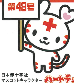
日本赤十字社 マスコットキャラクター ハートワゴン