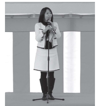
元法務大臣 参議院議員 森 まさこ 氏