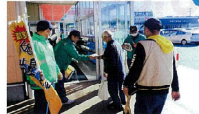
12月17日マルト窪田店での防犯パレードの実施状況

勿来防犯協会は、昭和52年9月に発足し、現在84名の会員で構成され、地域の安全と平穏を守るための各種活動を実施しています。犯罪のない街づくりや少年の健全育成のため、年間を通じた青色回転灯装備車両での巡回パトロールの他、関係機関と連携したなりすまし詐欺被害防止の街頭キャンペーン、さらには、地域住民の防犯意識の高揚のための立て看板の設置等を行い、様々な活動を通して、安全・安心のための地域づくりに積極的に貢献しています。