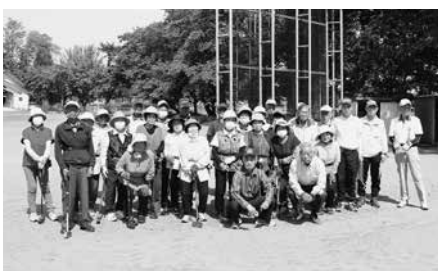
大会に参加された皆さん