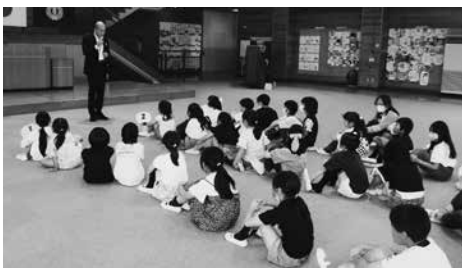
開級式の様子 (二小)