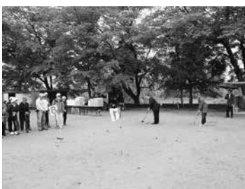
ゴルフ大会の様子