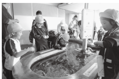
親子遠足を楽しむ子どもたち

幼稚園「自然観察会」 5月17日(金)「鳥峠の自然を守る会」の方々の協力により、泉崎幼稚園年長児を対象に自然観察会が行われました。 山頂までの道中で、道路脇の樹木や植物の名前を教えてもらったり、眺望を楽しんだり子どもたちは大興奮でした。その後、山頂の「鳥峠稲荷神社」を参拝しました。 自然を守る会の方々は、昼食にカレーライスを振舞い、食後のハーモニカやフルートの演奏、クイズやくじ引きで子どもたちを楽しませてくださいました。 子どもたちの感性が育まれた大切な一日となりました。