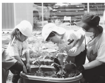
野菜の苗植えの様子

幼稚園「親子遠足」 5月31日(金)泉崎幼稚園年長児を対象に「親子遠足」が行われ、栃木県の「なかがわ水遊園」を訪れました。 何日も前から「てるてる坊主」を作り、遠足の日を楽しみにしていましたが、当日は朝から雨天でした。しかし、子どもたちは、幼稚園から離れた場所で、友達と一緒に活動できる喜びや、いつもと違う時間を過ごす嬉しさが止まらず、終始、晴れやかな表情で過ごしていました。 たくさん不思議や発見を楽しむことができた遠足となりました。