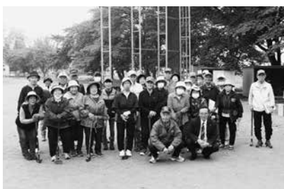
大会に参加された皆さん