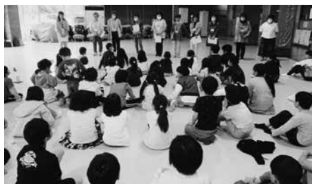
開級式の様子 (一小)

これからの教室でもたくさんの方たちと触れ合い、多くの経験を積んでほしいと思います。