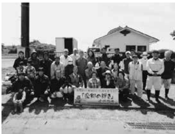
参加された皆さん