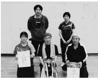
優勝した八雲A支部の皆さん