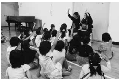
キッズ英会話教室の様子

楽しく授業を受けました。異文化交流カフェでは9名が参加して、旅行での体験や感想などの話題で英会話を楽しみました。キッズ英会話教室・異文化交流カフェは毎週水曜日中央公民館で行われております。