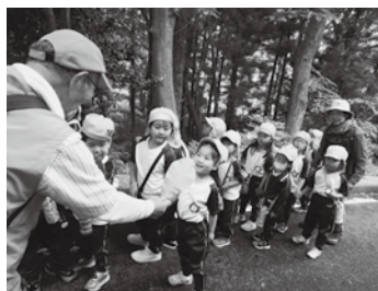
自然観察会の様子

二小6年生史跡泉崎横穴見学 5月23日(木)泉崎第二小学校6学年24名が、史跡泉崎横穴を見学しました。多くの児童が初めての見学で、4名1組で中に入り、泉崎横穴の説明を受けました。この見学がきっかけとなり、考古学に興味を持つ子どもたちが増えてほしいと思います。 なお、一般公開については、10月12日(土)10時から15時までを予定しております。 県内外から多くの見学者が訪れるイベントです。ぜひ見学会にご来場ください。