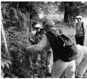
会員の説明を聞く児童

今後も村内の小学生や大人に向けての自然観察会を実施し、多くの方に村の自然に触れていただきたいと思っています。