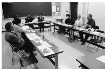
異文化交流カフェの様子