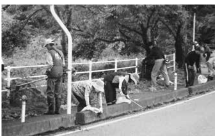
クリーンアップ作戦の様子

なお、第3回目は9月1日（日）を予定しています。今後も、ゴミのない泉崎村を目指して、村民の皆様、ご協力をよろしくお願いいたします。