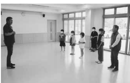
けん玉教室の様子