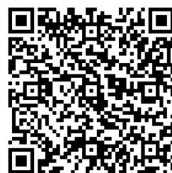
ワークショップ 申込用二次元コード