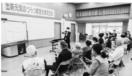
特別講演会での音楽療法の様子