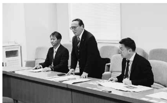
要望内容を説明する箭内村長(中央)