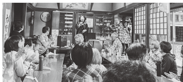
お楽しみ会では音楽演奏も

え、白河市からお越しいただいたシャンソン歌手の方の歌を聴くなど会員の方との交流を楽しみました。