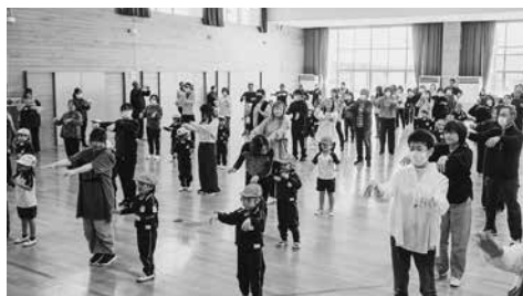
運動会ごっこの様子

泉崎村ボランティア連絡協議会子ども広場開催 10月26日(日)村民文化祭にて、泉崎村ボランティア連絡協議会が子ども広場を開催しました。 毎年恒例で大人気の子ども広場では、射的、紙袋制作、水ヨーヨーのプ