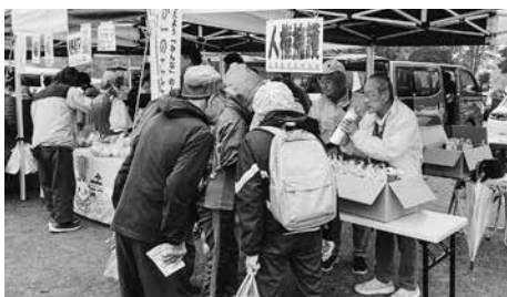
人権啓発活動の様子

来場者の方々に声を掛け、啓発グッズを配布することにより、人権擁護委員の活動を知っていただき、人権について考えていただく貴重な機会となりました。