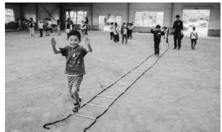
真剣に取り組む様子