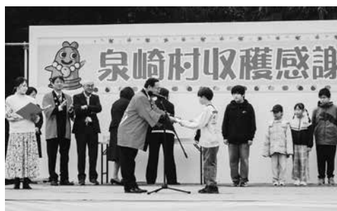
わが家のアイデア料理 コンクール表彰式