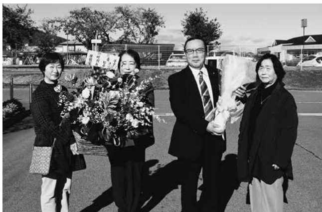
支援者より花束が贈られました