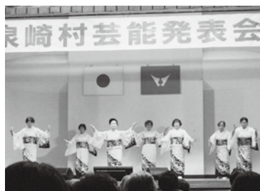
芸能発表会の様子

泉崎村芸能発表会 11月9日(日)泉崎村芸能団体連絡協議会主催の芸能発表会が中央公民館で開催されました。 今年結成された泉崎和太鼓愛好会も新たに加わり、子どもから大人まで多くの方が参加しました。出演者は華やかなステージ衣装に身を包み、歌や踊り、和太鼓演奏など、日頃の練習の成果を披露しました。