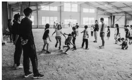
白熱したチーム対抗リレー