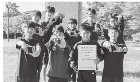
特設駅伝部(男子)の皆さん