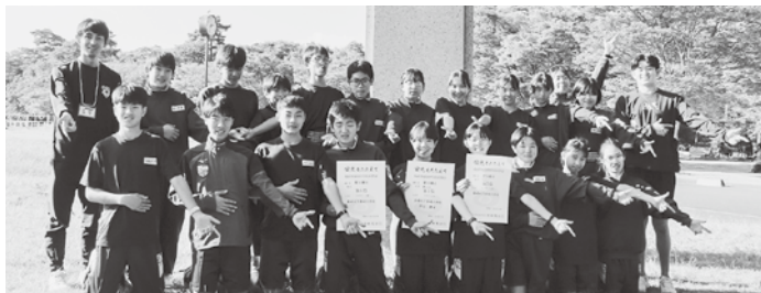
県大会に参加した皆さん