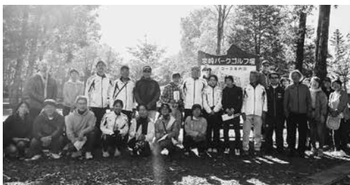
体験会に参加した皆さん

また開催してほしいとの要望がありましたので、来年度も開催予定です。皆さん奮ってご参加ください。