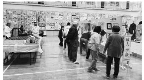
文化祭作品展の様子