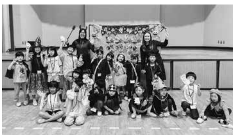
みんなでトリックオアトリート!

最後は「トリックオアトリート!」の掛け声とともに、2人の先生からお菓子のプレゼントをもらい、楽しい時間を過ごしました。