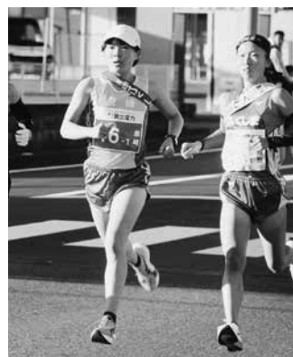
1区深谷凜桜選手 （泉崎中2年・写真左）