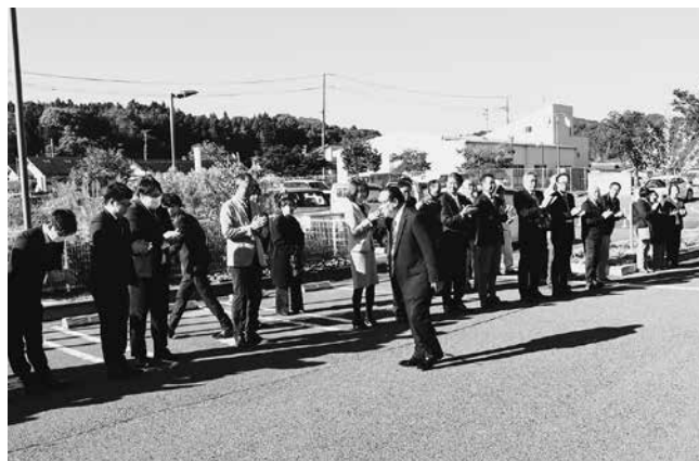
拍手で迎えられる箭内村長

10月14日（火）に告示された任期満了に伴う泉崎村長選挙において、無投票で2期目の当選を果たした箭内憲勝村長が、11月4日（火）に初登庁し、2期目の箭内村政がスタートしました。