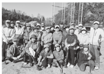
大会に参加した皆さん

泉崎村芸能発表会 11月9日(日)泉崎村芸能団体連絡協議会主催の芸能発表会が中央公民館で開催されました。 今年結成された泉崎和太鼓愛好会も新たに加わり、子どもから大人まで多くの方が参加しました。出演者は華やかなステージ衣装に身を包み、歌や踊り、和太鼓演奏など、日頃の練習の成果を披露しました。