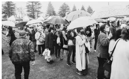
たくさんの方にお越しいただきました