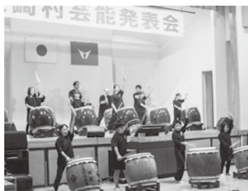
大迫力の和太鼓演奏