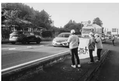
交通安全を呼びかける様子