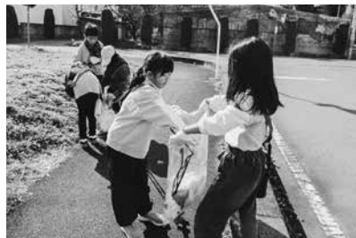
ごみ拾いに熱心に取り組む様子