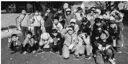
みんなで地域をきれいにするぞー！

参加した児童たちは、細かいところにまで目を配り、熱心に取り組む様子が見られました。約2kmの道路のごみ拾いを終えた児童からは、「たばこの吸い殻やペットボトル、レシートなどたくさんのごみがあった」と感想が聞かれ、公民館周りを担当した児童からは、「きれいになって良かったです。また来年もやりたいです」との声が聞かれました。