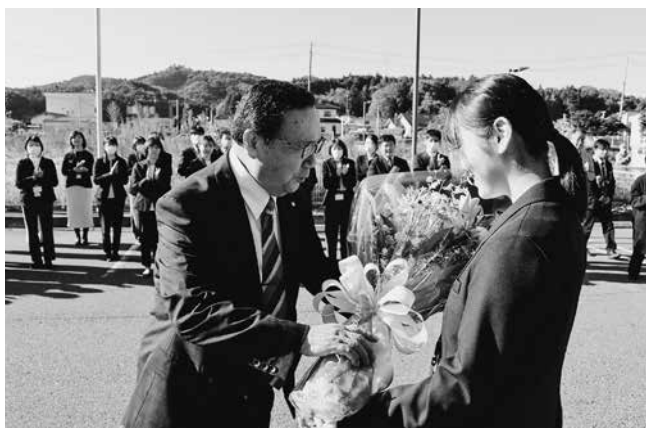
職員より花束が贈られました