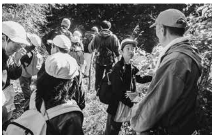
またたびの実を見つけたよ

38名が参加し、会員の案内により植物の説明を聞き、実際に触れながら頂上を目指しました。