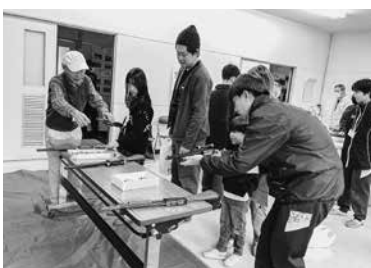
子ども広場の射的コーナー

レゼント、お化け屋敷ミニボッチャと、子どもたちが参加できる5つのコーナーを用意し、多くの子どもたちで大変賑わいました。 昨年に続き、中学生のボランティアも参加してくださり、子どもたちに優しく寄り添いながらお手伝いをし、たくさん子どもたちを楽しませていただきました。 ご協力いただきましたボランティアの皆さん、ありがとうございます。 泉崎村ボランティア連絡協議会では随時会員を募集しております。興味のある方は中央公民館(☎53・2258)までご連絡ください。