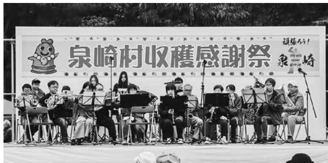
盛り上がりを見せたステージイベント