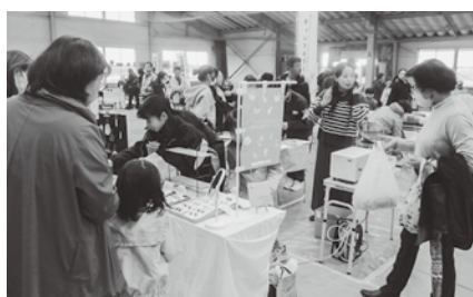
マルシェ会場の様子

地域スクラム応援隊は結成9年目を迎え、現在19名の方がボランティアで主に登下校時の子どもたちの見守り活動に取り組んでいます。今後も地域スクラム応援隊の活動にご理解ご協力をお願いいたします。