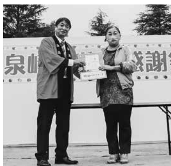
お楽しみ抽選会特賞の贈呈