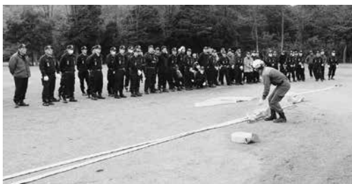
消防隊員から指導を受ける様子