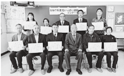
特選に輝いた皆さん