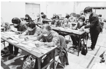
「マイ避難シート」を作成する学級生の皆さん

災害への備えや避難に関する講習では、実際に自分の住む地域や自分の家族構成を想定しながら、「マイ避難シート」を使い、避難する上で必要なものやタイミングをシートに落とし込むことで、より「自分事」として捉えることができる、とても学びの多い時間となりました。