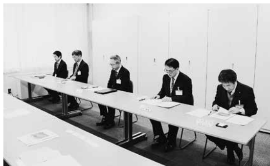
矢澤土木部長(中央)と土木部幹部の皆様