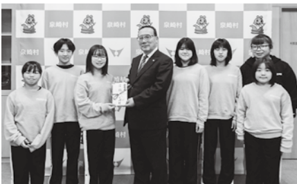
激励金交付式の様子

11月25日(火)泉崎バレーボールスポーツ少年団の選手たちが来庁され、12月13日(土)、14日(日)に開催された県大会への出場報告と県大会での活躍を村長に誓い、村長より激励金が交付されました。