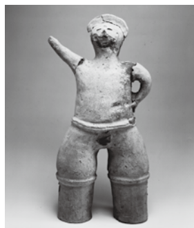
りきしぞう 力士像