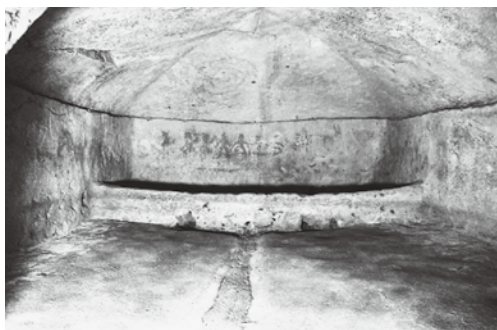
いずみざきよこあなげんしつないぶ 泉崎横穴玄室内部

いずみざきむら えきでん つよ むら さか むら い おお いせき むら はにわ むら 泉崎村は、「駅伝の強い村」「バスケットが盛んな村」と言われることが多いですが、「遺跡の村」「埴輪の村」という言葉は泉崎村を紹介するときによく使われます。その名のとおりに、泉崎村には国指定の文化財をはじめ、貴重な文化財が数多くあり、古くから先人の生活の様子が偲ばれる歴史ある村です。 くにしていぶんかざい けん けんしていぶんかざい けん むらしていぶんかざい けん ひじょう おお ぶんかざい しょうゆ 国指定文化財2件、県指定文化財2件、村指定文化財11件と非常に多くの文化財を所有しています。その泉崎村の文化財をもっと知ってもらうために、次号から1件ずつ紹介していきたいと思います。 じごう いずみざきよこあな しょうかい じっさい い けんがく かた おお 次号では、「泉崎横穴」を紹介します。実際に行き、見学したことがある方も多いのではないのでしょうか。毎年10月第2土曜日に一般公開しており、県内外より多くの方が見学に訪れます。歴史的にも貴重な文化遺産です。来年の一般公開の際には、まだ行ったことがない方はもちろん、行ったことがある方も年に一度の貴重な機会に、ぜひ見学に訪れてみてください。