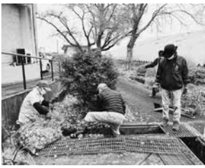
会員の方による 清掃活動の様子