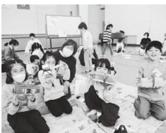
びっくり箱の完成！

作品発表の時間には、びっくり箱を実際に開け思った以上に中身が勢いよく飛び出す様子に、参加者は思わず笑顔になっていました。