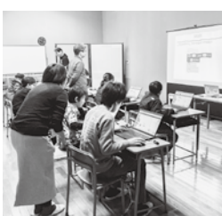
プログラミングに挑戦する子どもたち

教室後のアンケートでも、ほとんどの参加者から「楽しかった」「また参加したい」「今後もプログラミングを続けたい」と回答があり、充実した教室となったようでした。