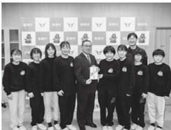
激励金交付式の様子

11月25日(火)泉崎ミニバスケットボールスポーツ少年団の選手たちが来庁し、県大会への出場報告と県大会での活躍を村長に誓い、村長より激励金が交付されました。