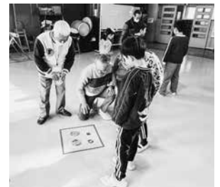
めんこを教わる子どもたち

ご協力いただきましたボランティアの皆さん、ありがとうございます。ボランティア連絡協議会では、子どもたちと一緒に楽しみながら昔遊びを教えてください。興味のある方は、中央公民館(☎53・2258)までお問い合わせください。