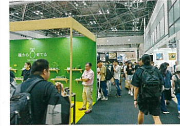
ギフトショー視察の様子