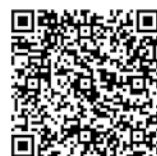
申込用紙請求用 二次元コード

②受験票を受領したときは、6か月以内に撮影した本人の写真(上半身、脱帽、正面向き、縦6cm×横4cm)1枚を写真欄に貼って受験当日に必ず持参してください。(受験票がない場合、又は受験票に写真を貼っていない場合は、受験できません。)