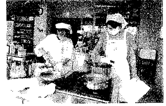
泉崎村日赤奉仕団による ボランティア活動