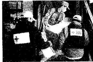
能登半島地震において 救援物資を運搬する救護班

国内災害救護 医療事業 看護師等育成事業 血液事業 国際活動 社会福祉事業 救急法等の講習 赤十字ボランティア 青少年赤十字