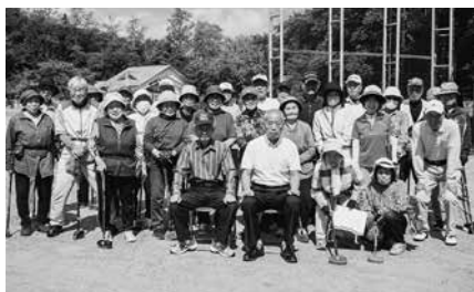
大会に参加された皆さん