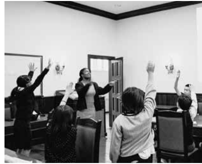
積極的にゲームに参加