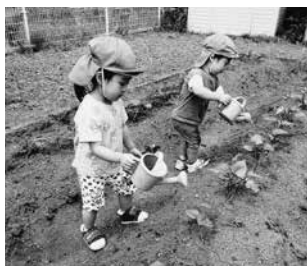
苗に水をやる子どもたち

からとても嬉しそうでした。苗植えでは、少し緊張した表情も見られましたが、先生と一緒に苗植えを楽しみることができました。