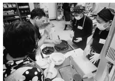
クック&クッキング教室の様子

最後に、できあがった料理をみんなでいただき、受講生からは「おいしかった。家でも教わったアレンジで作ってみた」という声が聞かれ、とても楽しい教室となりました。