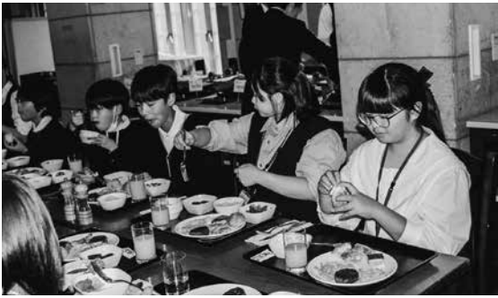
テーブルマナーを学ぶランチ