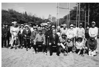
大会に参加された皆さん