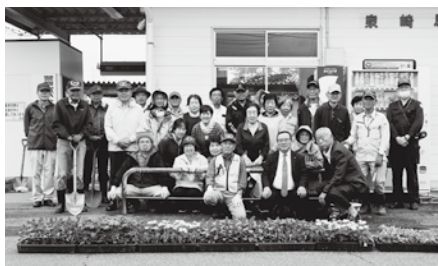
環境美化作戦に参加された皆さん

汗を流したほか、駅前を彩る花壇にマリーゴールド、サルビア、ペゴニアの3種類の花、約200本を一つひとつ丁寧に植え付けました。 泉崎駅をご利用の際や、お近くをお通りの際は、ぜひ皆さんの愛情が詰まった素敵な花壇をご覧ください。