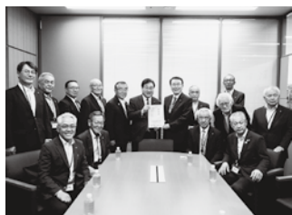
菅家一郎衆議院議員へ要望書を手渡す様子