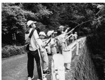
植物や樹木の説明を受けている子どもたち

泉崎第二小学校4年生の児童25名が参加し、会員の案内により爽やかな初夏の風が吹き抜ける林道で自然観察を行いました。普段見かけない植物が多く見られ、児童からも様々な質問が飛び交い、熱心に耳を傾ける様子が多々ありました。