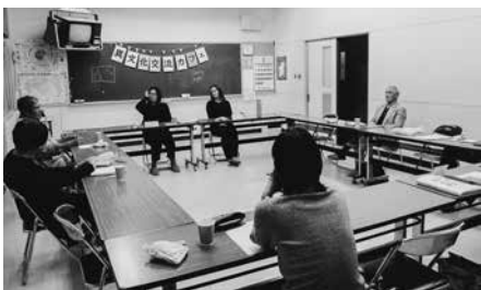
異文化交流カフェの様子