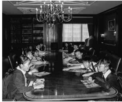
館内を見学する児童