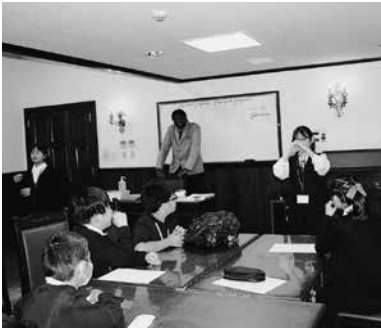
ジェスチャーゲームの様子