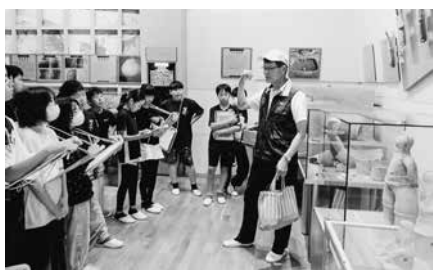
資料館での学習の様子