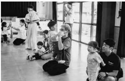
保護者と一緒に触れ合い遊び

保育参観では、クラスごとにおやつの様子を見ていただき、先生による絵本の読み聞かせや音楽に合わせて触れ合い遊びなどをして、親子で楽しい時間を過ごしました。