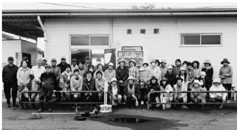
除草作業に参加された皆さん

この除草作業は、毎年この時期、村民生児童委員協議会の協力を得て実施されています。今回は併せて約50名が参加しました。