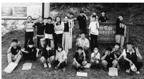
横穴を見学する二小6年生の皆さん

10時から15時までを予定しております。年に1度の貴重な公開日です。古代ロマンあふれる時代に思いを馳せてみませんか。