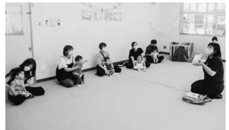
先生による絵本の読み聞かせの様子