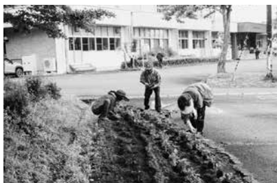
花植えボランティアの様子

会員の皆さんから「ぜひお手伝いしたい」とのお申し出をいただき、率先して花植え作業に取り組んでいただきました。おかげさまで花壇がとともきれいになりました。ご協力いただきましたボランティアの皆さん、ありがとうございました。