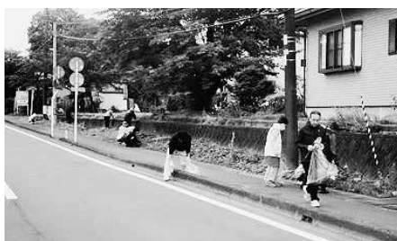
クリーンアップ作戦の様子

たほか、会員によるカレイライスの振舞いや、ハーモニカ、フルーツの演奏、大声・腕相撲大会等が実施され、児童たちは自然の中で会員の方との交流を楽しみました。今後も村内の幅広い世代を対象とした自然観察会を実施し、多くの方との交流を深めるとともに村の自然に触れていただく予定です。