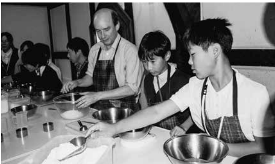
スコーン作りを体験する児童