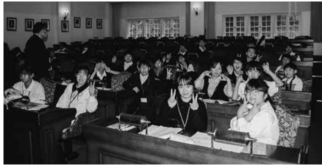
笑顔で楽しむ児童