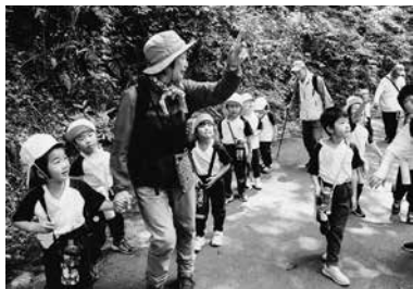
頂上を目指す子どもたち

出発式では、子どもたちが「頂上目指して、頑張るぞー！えい、えい、おー！」と元気に声を出し、意気込んで登り始めていく姿が見られました。鳥峠入り口の駐車場から鳥峠稲荷神社までの舗装道路を、ボランティアの方を先導に4つの班に分かれて登りました。山の中の樹木や植物の名前を教えてもらったり、円満平での景色を見せていただいたり、「大声大会」で「ヤッホー！」と声を出したりして、疲れを感じさせない山登りとなりました。