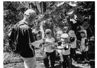
植物の説明を受けている子どもたち

子どもたちは、山登りを通してたくさんの方との触れ合いを楽しみ、園内では体験することのできない素晴らしい時間を自然の中で過ごすことができました。