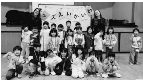
キッズ英会話教室に参加された皆さん

キッズ英会話教室・異文化交流カフェは毎週水曜日に中央公民館で開催しています。興味のある方はお気軽にお問い合わせください。 (☎53・2258)