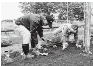
駅花壇に花を植える様子

この活動は、駅周辺をきれいに保つことで犯罪の減少(防犯環境の向上)を目指すものです。当日は防犯指導隊をはじめ、泉崎駐在所、民生児童委員、そして宿館老人クラブの皆さんも応援に駆けつけ、総勢30名で作業に取り組みました。 参加者は、駅周辺の清掃や除草、立木の剪定に